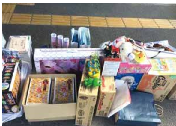
RCメンバーからの景品提供に感謝！