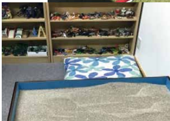
カウンセリング室には、箱砂が置いてあります。虐待で言葉を話せなくなった子供は人形で心の中の様子を物語にします。