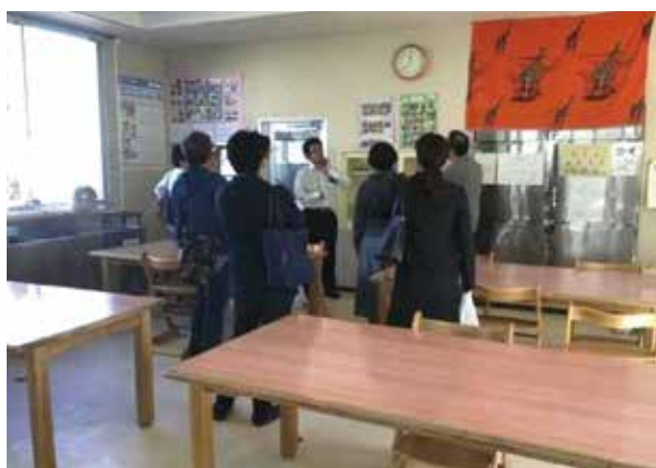
食堂です。高校生になったら、アパートのような自炊が出来る部屋で自活生活をします。