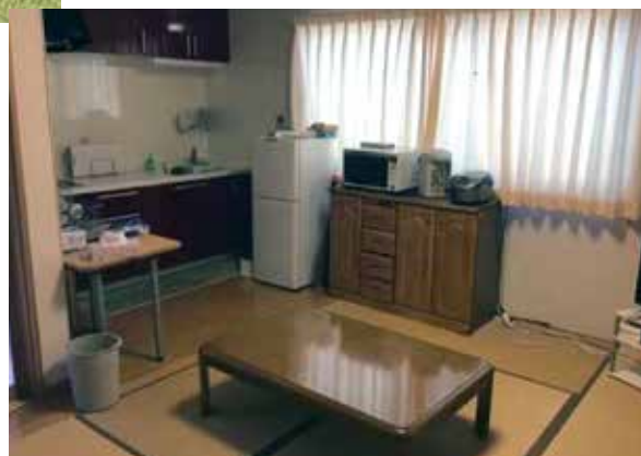
親子で少しお話が出来るようになったら、家庭の居間のような部屋で対面して、様子をみます。